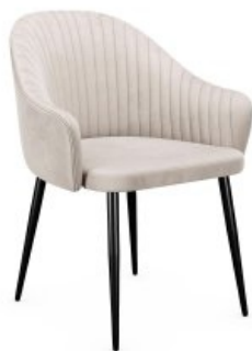
Стул DikLine 440