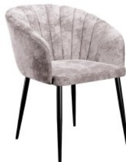
Стул DikLine 441

Перед началом сборки проверьте наличие всех деталей и фурнитуры согласно инструкции. Убедитесь, что все детали целы и не имеют дефектов. При наличии дефектов сохраняйте упаковку с этикетками. После начала процесса сборки производитель снимает с себя ответственность за повреждения деталей и изделия, а также за количество деталей, входящих в комплект изделия.