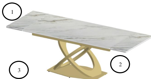
Рис. 2 Стол «ЕКЕ160» с разложенными торцевыми вставками