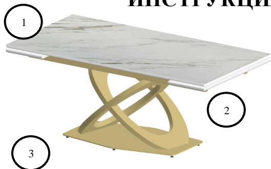
Рис. 1 Стол «ЕКЕ160» со сложенными торцевыми вставками