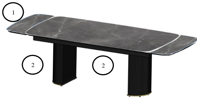
Рис. 2 Стол «ЕКР205» с разложенными торцевыми вставками