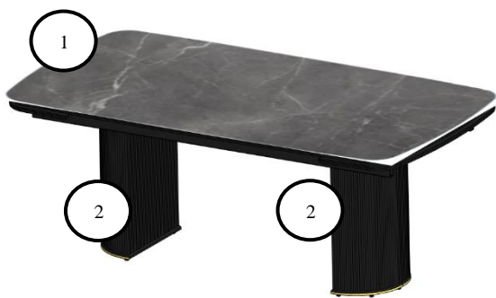
Рис. 1 Стол «ЕКР205» со сложенными торцевыми вставками